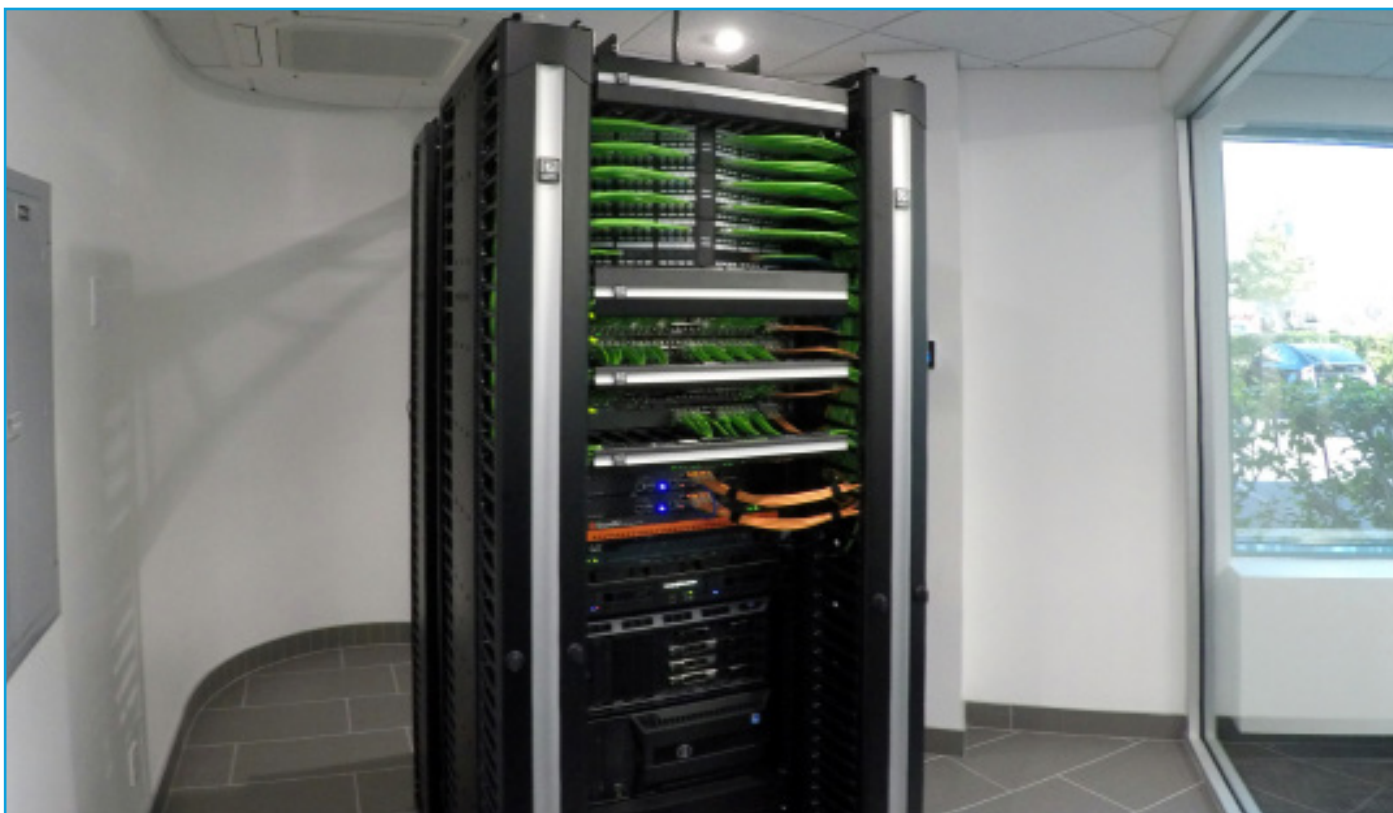
网络受 CPI 的四支柱 QuadraRack 与 Evolution 垂直和水平理线器及通用缆线桥架的支持。