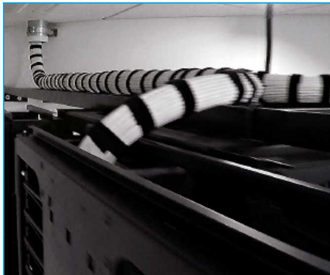
CPI 通用桥架为进出理线器的缆线提供可靠支持。