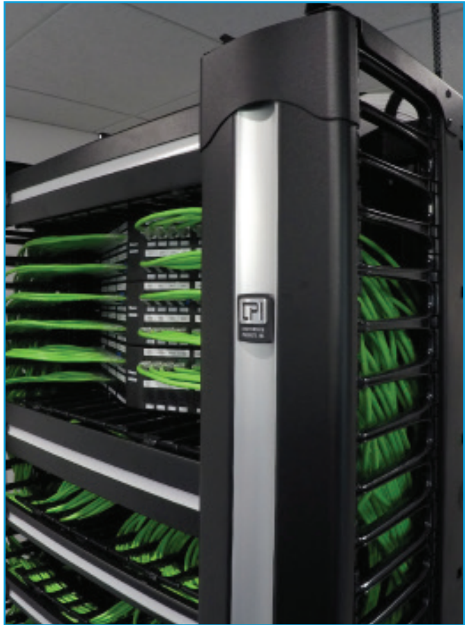
CPI Evolution® 垂直和水平理线器是高密度布线的可靠解决方案。SCCS 拥有继续发展业务所需的 IT 基础设施支持。

Mann 找来了 IT 集成商 Skyward Technical Solutions 来帮助负责该项目的 IT 网络和集成部分，并且找来了 DIVAD Network Solutions，他们是南加利福尼亚专门从事结构化布线、无线和安全系统的专业承包商。