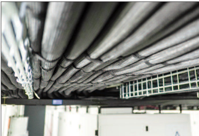
CPI 的缆线桥架甚至以倒置方式安装以适应有限空间，为缆线提供适当的支撑。

IDS 使用了独特的缆线桥架方法，将缆线桥架倒置安装，这种方法最大限度地减小了接触桥架所需的空间，但仍可为缆线提供适当的支撑。