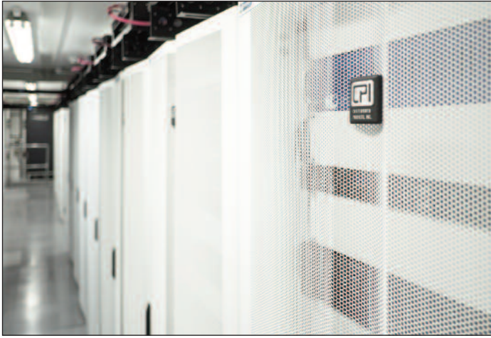
CPI 的 GF 系列 GlobalFrame 机柜网口面积为 78%，可最大限度改善气流。